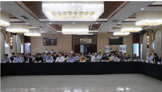
图 2 会议现场